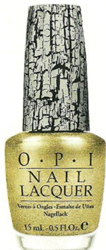
Esmalte ($119, Opi)

Blanco, dorado y plata, una combinación ultra chic y femenina. Poderosa seducción.