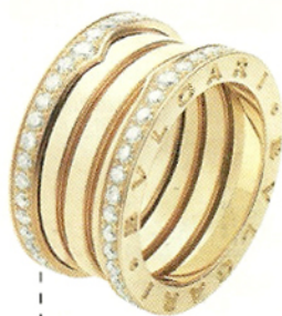
Anillo (Bzero Pink gold de Bulgari para Chronos BA)