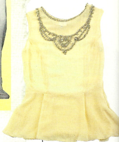
Top con pedreria ($2500, Sathya)