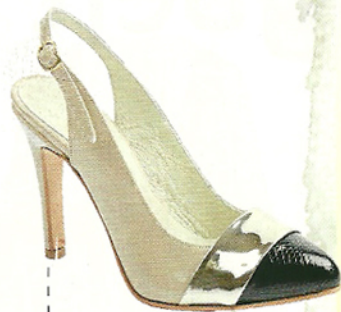
Zapato sin talon ($1880, Ferraro)