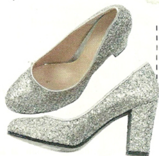
Zapatos glitter ($1830, Pepe Cantero)