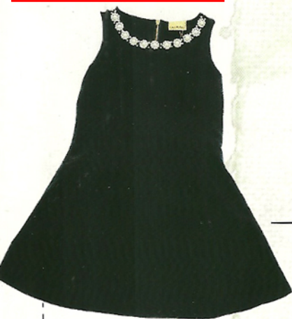
Vestido con aplique de perlas ($1290, Las Pepas)