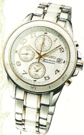
Reloj Sportura Dama (USD1530, Seiko)